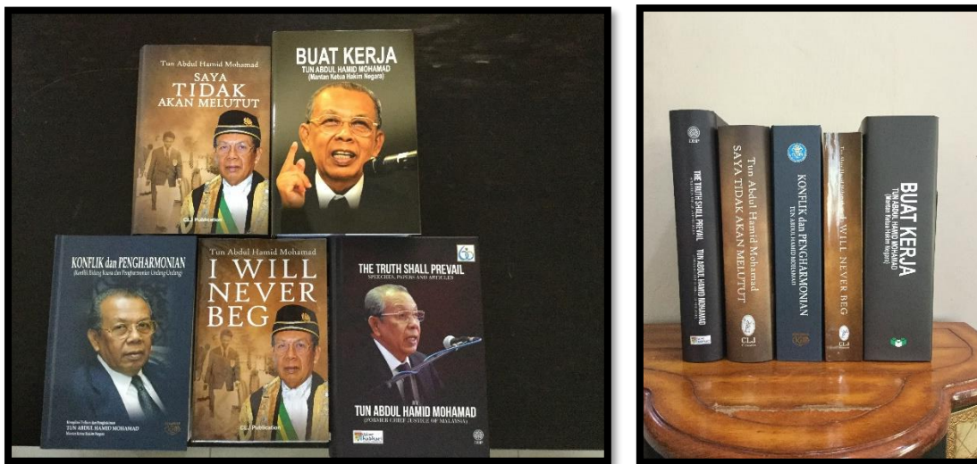
Buku-buku hasil tulisan Tun Abdul Hamid

Beliau juga telah menulis lima buah buku yang berjumlah 3,604 halaman. Buku-buku itu ialah: I Will Never Beg, Saya Tidak Akan Melutut, The Truth Shall Prevail, Konflik dan Pengharmonian dan Buat Kerja. Beliau menekankan bahawa setiap patah perkataan dan setiap koma dan noktah ditulis atau ditaip oleh beliau sendiri, termasuk yang, di-akhir-akhir ini, dilakukan sambil terlentang dengan memegang mini Ipad dengan sebelah tangan dan menaip dengan jarinya yang kebas dan kaku.