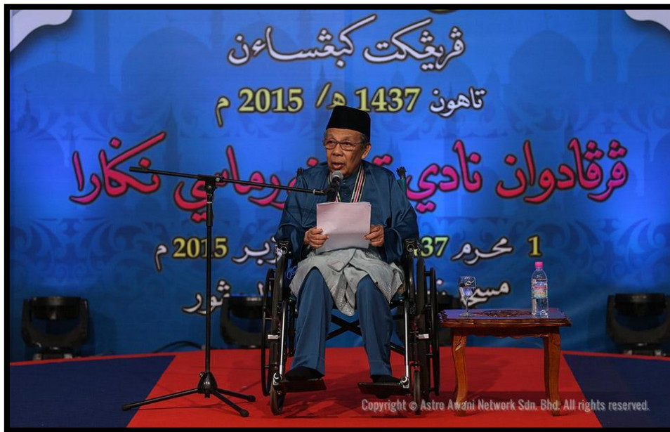
Tun Abdul Hamid menyampaikan ucapan di Majlis Anugerah Tokoh Maal Hijrah 1437H/ 2015M.